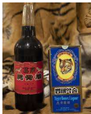
Tigriscsontból készült ital. A különböző készítmények előállításához tartott nagymacskákat etikátlan körülmények között tartják különböző farmokon, megfelelő hely és ellátás nélkül.

Bár ma már számos törvény és nemzetközi egyezmény szabályozza a nagymacskák kereskedelmét és tartását, ennek illegális formája még mindig súlyos probléma. Mint a tiszafüredi tigris példáján is láthattuk, továbbra is vannak, akik birtokolni szeretnék ezeket az állatokat, egyfajta dísz tárgyként vagy státuszszimbólumként, kereskedelmük pedig szinte mindig kapcsolódik más bűncselekményekhez is. Emellett pedig egyes helyeken a népi gyógyászatban rendkívüli hatást tulajdonítanak a nagymacskák karmaiból és csontjaiból készült készítményeknek, holott ezek hatását már több tanulmány is cáfolta.