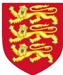
Anglia címere. Az oroszlánok a nemesség szimbólumaként gyakran előfordulnak címerekben.

A nagymacskák sokak kedvenc állatai és az állatkertek talán legnépszerűbb lakói. Gyönyörű, különleges megjelenésük és veszélyességük miatt évezredek csodálat övezi őket. Számos nép kultúrájában és mitológiájában van fontos szerepük, de a művészetekben is gyakran megjelennek. Gondoljunk csak Kipling Sír Kánjára, vagy akár az Oroszlánkirály szereplőire. Nem csoda, hogy sokáig élt az emberekben a vágy, hogy megszelídítsék ezeket az állatokat, vagy legalább birtokolják őket. Az oroszlánok a Colosseumi játékok gyakori résztvevői voltak, illetve a nagymacskák kedvelt ajándéknak is számítottak az uralkodók és nemesek számára, nem is beszélve a bundájukról. Az élővilág effajta kizsákmányolás odáig vezetett, hogy számos alfajuk ma már kihalt és szigorú szabályozásra van szükség ahhoz, hogy mind a mai napig láthassuk ezeket az állatokat.